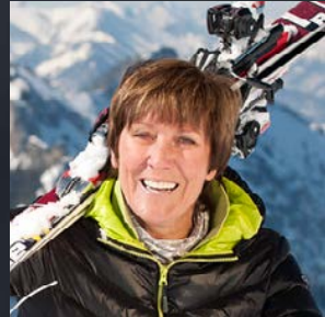
EVI MITTERMAIER- BRUNDOBLER